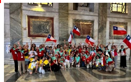
Cursilistas do Chile