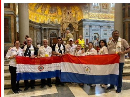
Cursilistas do Paraguai