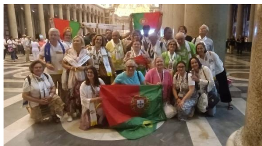
Cursilistas da Diocese de Lisboa