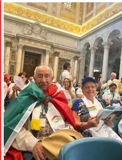
Cursilistas do Mexico