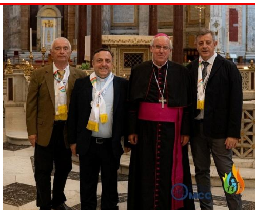
Comité do OMCC