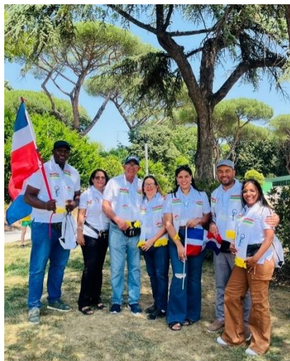
Cursilistas da Republica Dominicana