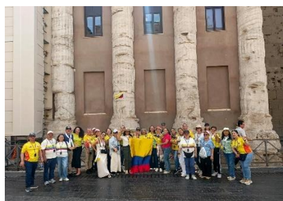
Cursilistas da Colombia