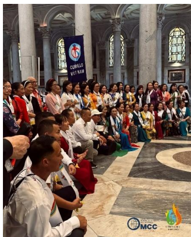
Cursilistas do Vietnam