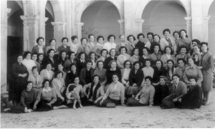
1.º Cursillo de mujeres - 2 de Mayo de 1.958 Selva del Campo (Tarragona)